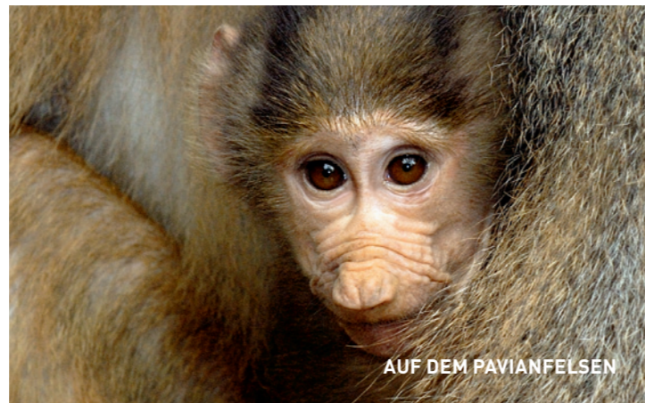
AUF DEM PAVIANFELSEN

DE DIERENTUIN VAN KEULEN OPENDE IN 1860 voor het eerst zijn poorten. Enkele historische gebouwen zoals het vroegere olifantenhuis of het Zuid-Amerikahuis, zijn ook nu nog typisch voor deze dierentuin. Ontdek een der oudste en tegelijk modernste dierentuinen ter wereld.