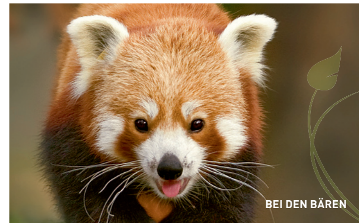
BEI DEN BÄREN

■ HET HELE JAAR meer dan 80 procent luchtvochtigheid – in het regenwoudhuis van de Keulse dierentuin voelen dubbelhoornvogels en andere tropische dieren zich thuis. Ontdek dieren zoals de matschieboomkangaroo. In de onderzoekshut verneemt u wetenswaardigheden over de natuurbeschermingsprojecten van de dierentuin.